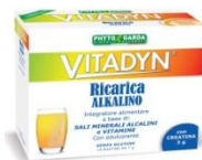
Vitadyn ricarica alcalino