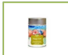
2 Tè o Tisana Jade