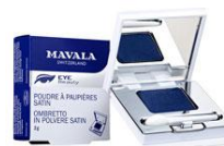
Ombretto satin mavala