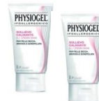
2 crema mani Physiogel