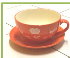
Tazzona d'arredo Diametro 30cm