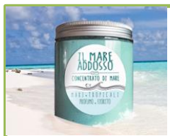
Sapone Marino Scrub 500 ml