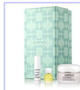
Cofanetto DARPHIN PREDEMINE •CREMA TAGLIO VENDITA •OLIO VISO •SIERO TAGLIA VIAGGIO