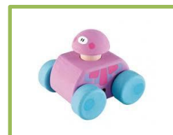
Giocattolo in legno SEVI