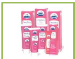
Due Prodotti a scelta della linea Euphidra AmidoMio