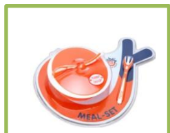
Set Pappa Mebby