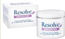
Crema smagliature Reslove